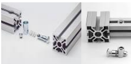
Système de fixation PVS rigide inventé par KANYA

Le système d'assemblage de profilés PVS vous propose un assortiment très diversifié et bien étudié, tous accessoires inclus. Qu'il s'agisse de charges légères, de contraintes massives ou pour revêtement en tous genres, que la coupe soit à face plane ou d'onglet, le système PVS convient toujours.